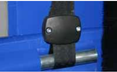
Enganche de cintas