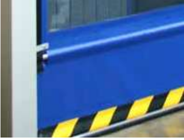
Detalle de bolsa de lona de puerta rápida apilable